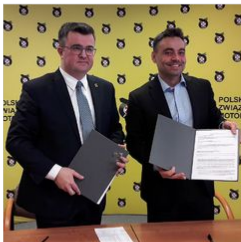
Piąty rok Nice 1 Ligi Żużlowej!