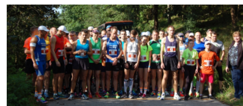
VI Bieg Pamięci Karolewo - Więcbork - fotorelacja ze startu

BYDGOSKIE TOWARZYSTWO ŻUŻLOWE ZAPRASZA NA ZAWODY: