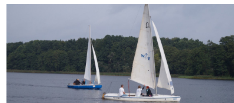
VII edycja "Krajna Cup" za nami!

Finał Drużynowych Mistrzostw Polski 80-125cc