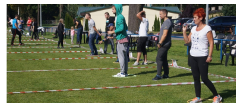
I Mistrzostwa Miasta i Gminy w Bule zakończone!