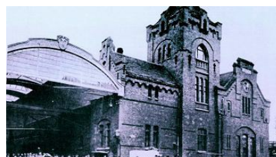
Wycieczka w czasie na Jakobsvorstadt [STARE ZDJĘCIA]