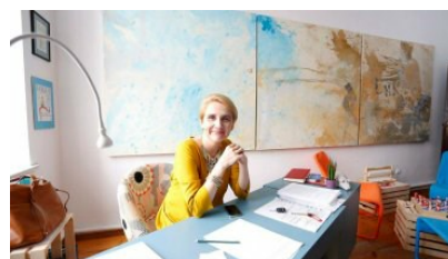
Scheuring-Wielgus pokazała swoje biuro. Robi wrażenie

Co warte podkreślenia, firma Nice startuje w cyklu drugi rok z rzędu.