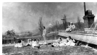
Toruń - pełnomorski port i szkoła morska 200 km od Bałtyku