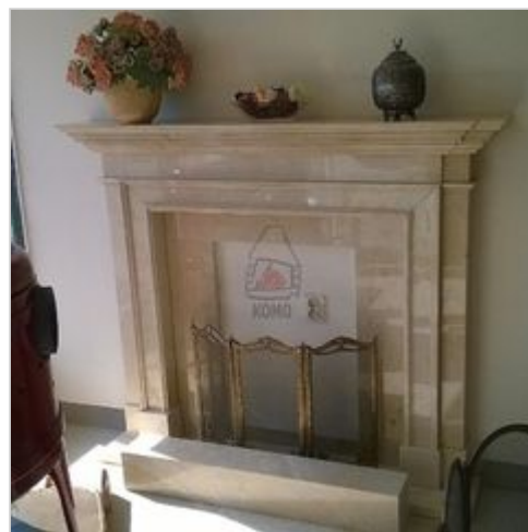
Obudowy i ramy kominkowe Komo