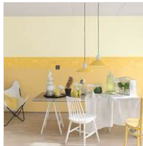
Wysmakowana jadalnia w kolorach Tikkurila