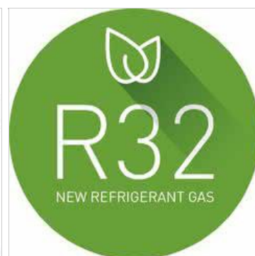
Panasonic ogłasza całkowite przejście na czynnik chłodniczy R32