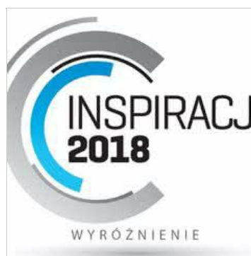
Ręcznie postarzana podłoga Baltic Wood z tytułem INSPIRACJA 2018