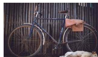
Rower oparty o płot