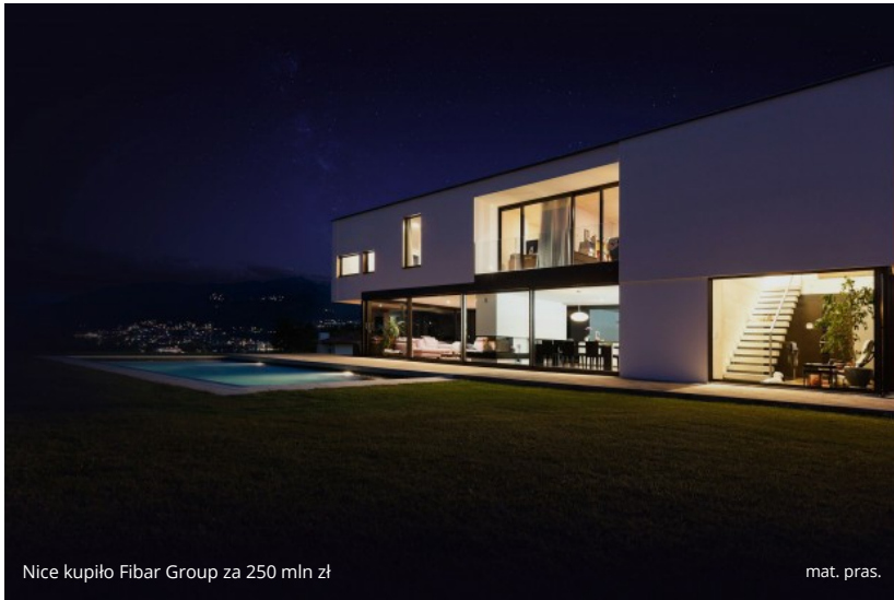
Nice kupiło Fibar Group za 250 mln zł