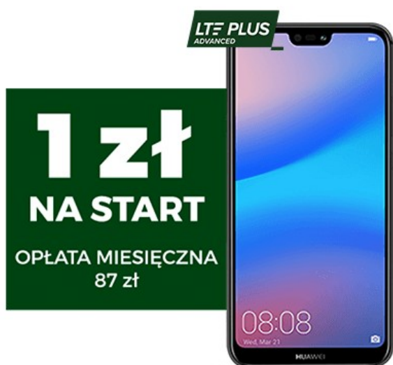
HUAWEI P20 LITE

Wszystko bez limitów i Internet bez kosztów