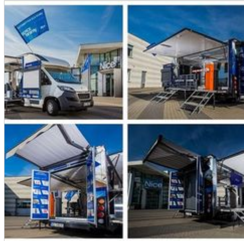
Nice Show Car: Nowa jakość ekspozycji produktów Nice!