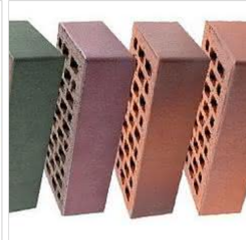
LODE - Największy wybór cegieł m.in. profilowanych, klinkierowych oraz drażonych