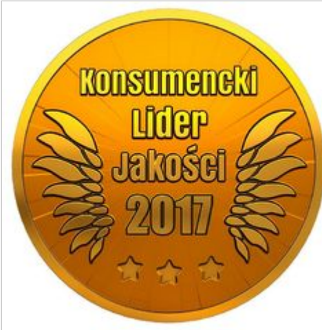
Braas Konsumentkim Liderem Jakości 2017