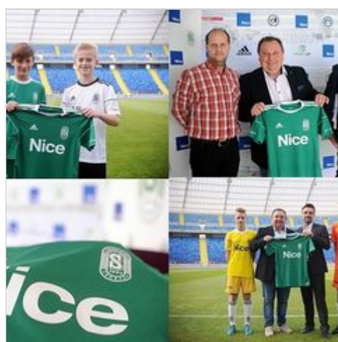
Nice objął mecenatem Akademię Piłkarską Stadionu Śląskiego!