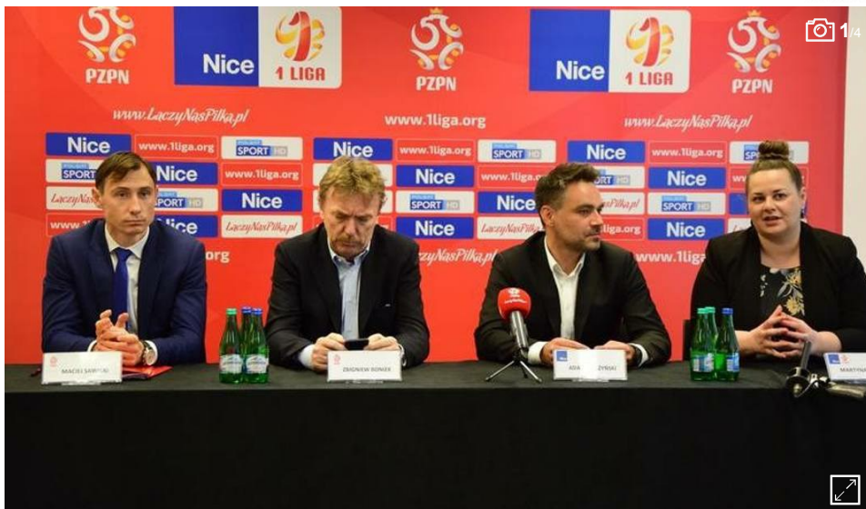
Firma Nice Polska będzie sponsorem tytularnym pierwszej ligi przynajmniej do końca następnego sezonu.