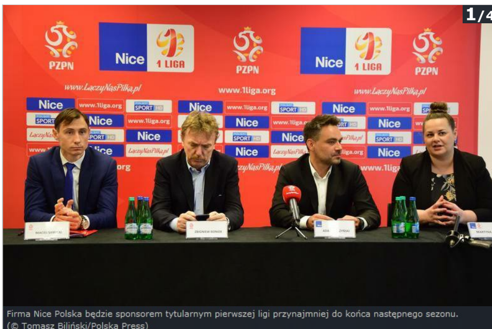
Firma Nice Polska będzie sponsorem tytularnym pierwszej ligi przynajmniej do końca następnego sezonu.