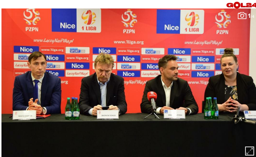
1 liga ma sponsora tytularnego

red 27 lutego 2017 Aktualizacja: 27 lutego 2017 23:07