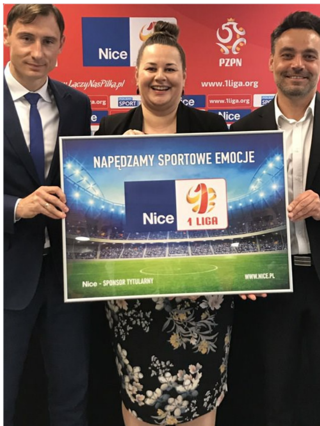
Zbigniew Boniek @BoniekZibi