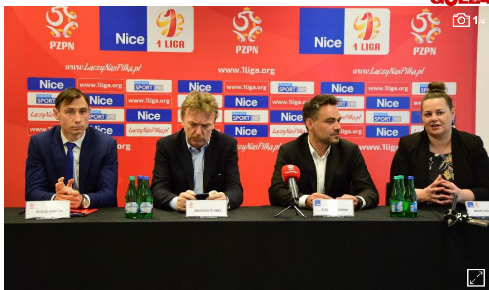
1 liga ma sponsora tytularnego