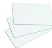
KARTA Karta abonamentowa lub RFID