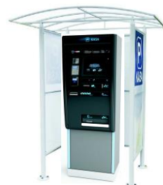
Zadaszenie zewnętrzne WP307