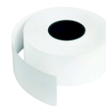
ROLKA TERMICZNA Papier do wydruku biletów