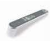
MEA5 dźwignia odblokowująca do MEA3 (dodatkowa)