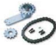
MEA1 akcesoria zwiększające kąt otwarcia do 180°