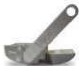
MEA3 mechanizm odblokowania awaryjnego przy pomocy dźwigni odporny na zanieczyszczenia