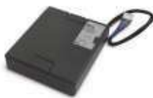
PS324 akumulator 24V 2.2 Ah z wbudowaną kartą ładowania do centrali MC824H