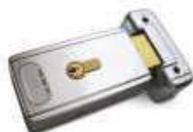
PLA11 zamek elektromagnetyczny poziomy