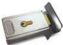
PLA10 zamek elektromagnetyczny pionowy