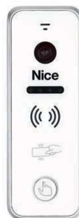
EYE PLUS W