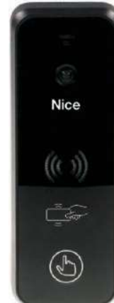
EYE PLUS B