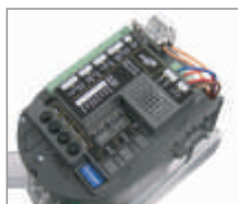
Wbudowana centrala sterująca ułatwiająca programowanie