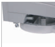
Precyzyjna regulacja ograniczników krańcowych