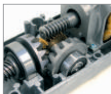
Przekładnia wykonana z brązu - trwała, solidna i niezawodna