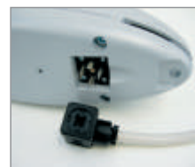
Łatwe i szybkie podłączenie zasilania