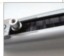
Opcjonalne szczotki zabezpieczające