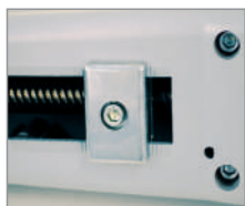
Mechaniczne wyłączniki krańcowe