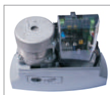
Centrala sterująca zasilana napięciem 230V