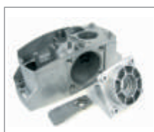
4,5 kg aluminium