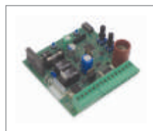
Centrala sterująca GD 20