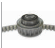
Mechanizm z łożyskiem kulkowym