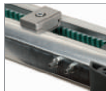
Stalowa prowadnica, blacha grubości 1,3 mm