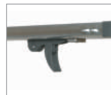
Innowacyjny system wysprężania