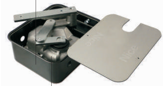
Hermetyczny, stopień zabezpieczenia IP67

Metro: najnowsze modele wytłaczanych skrzynek fundamentalnych, odporne na korozję!